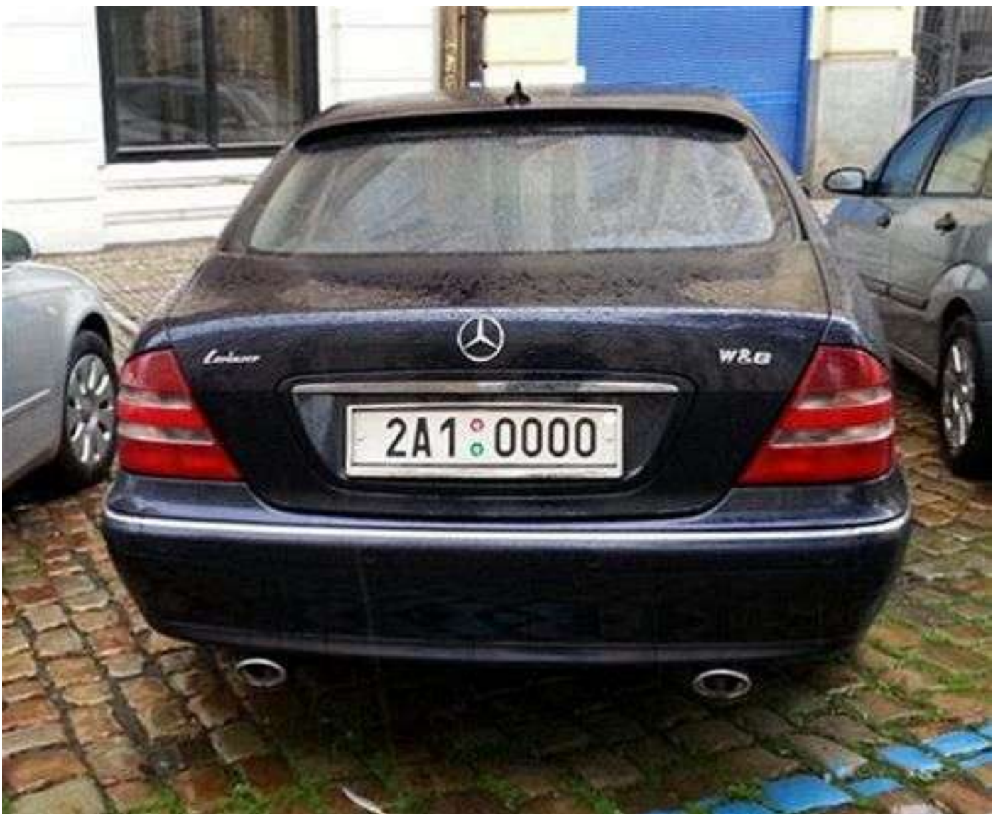
Capo di tutti capi